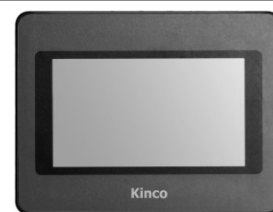
MT4230T / MT4230TE